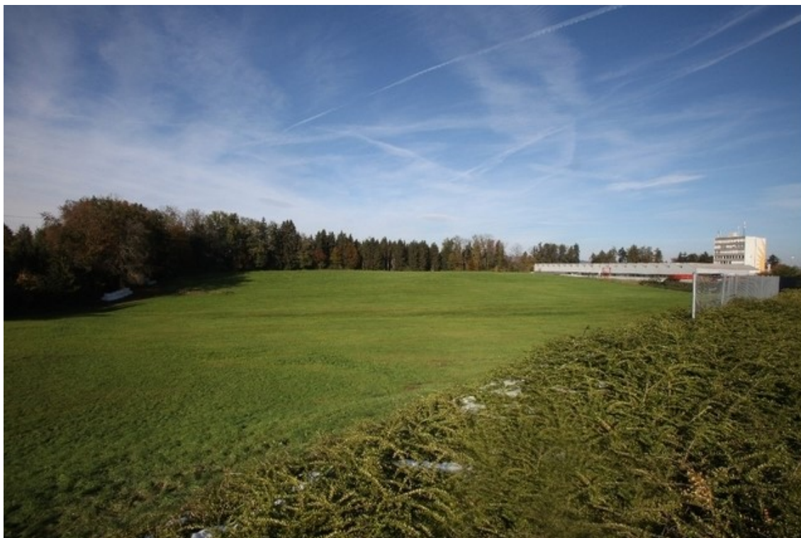
Der Gewerbepark soll auf dem Rütihof-Areal neben der Autobahn entstehen.

Die Gestaltung des Gewerbeparks «Werkstadt ZÜRISSEE» kommt planmässig voran. Zwölf Interessenten wurde bis jetzt ein Landangebot unterbreitet. Kämen alle Verträge zustande, wäre der Gewerbepark bereits voll.